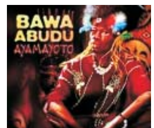
Title: AYAMAYOTO Album Nummer: 82876 53030 2 6 Distributed by: BMG & NA KLAR